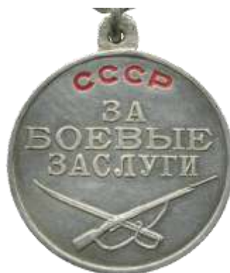
Медаль "За боевые заслуги"